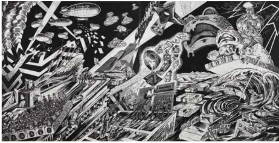
表 Front Image 《ありがとう、我が愛する白鳥よ!》(部分)My thanks to you, dear swan! (detail) 2026 作家蔵 Collection of the Artist ©Sachiko Kazama, Courtesy of the artist and MUJIN-TO Production Photo by Kei Miyajima 01 《第一次幻惑大戦》Great Dazzle War 2017 横浜美術館蔵 Collection of Yokohama Museum of Art ©Sachiko Kazama Courtesy of the artist and MUJIN-TO Production Photo by Kei Miyajima 02 《ニュー松島(千島島)》New Matsushima (Sengan jima) 2022 作家蔵 Collection of the Artist ©Sachiko Kazama Courtesy of the artist and MUJIN-TO Production Photo by Kenji Morita 03 《白鳥の聲が聞こえる》Hear the voice of the swan 2026 作家蔵 Collection of the Artist ©Sachiko Kazama Courtesy of the artist and MUJIN-TO Production Photo by Kei Miyajima