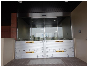
【 防水板 】