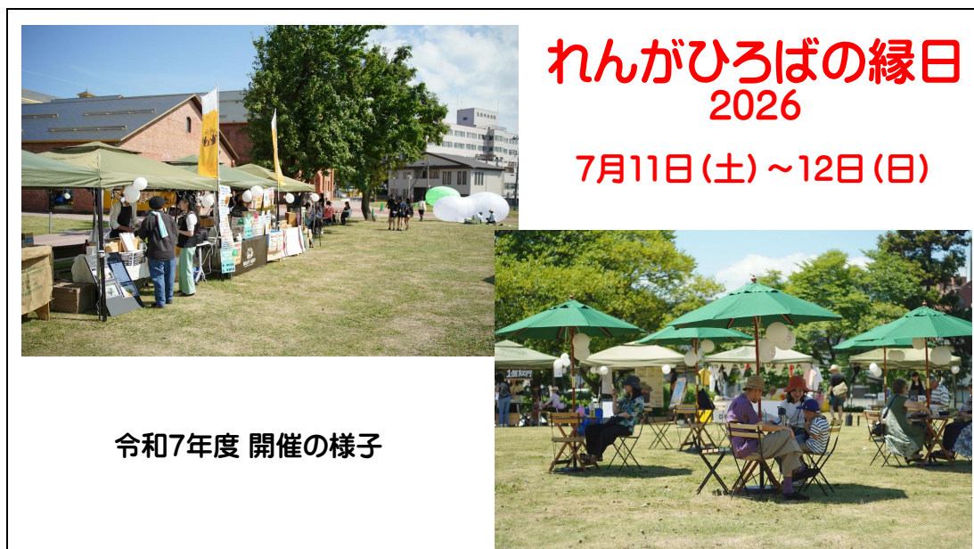
令和7年度 開催の様子