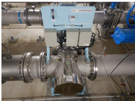
【 紫外線処理設備 】