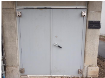
【 防水扉 】